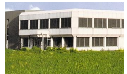
Usine fabrication Nord situé à Vieux thann (68)

Les réducteurs à roue et vis UNIVERSAL et coaxiaux NORBLOC proposent une nouvelle génération de réducteurs. Le carter en aluminium moulé sous pression rigide garantit une grande sécurité de fonctionnement même avec des charges importantes. La caractéristique principale de cette gamme est sa totale modularité. Les adaptateurs IEC/Nema, le train primaire d'entrée sont proposés sous la forme de modules finis et entièrement étanche qui peuvent être assemblés très facilement.